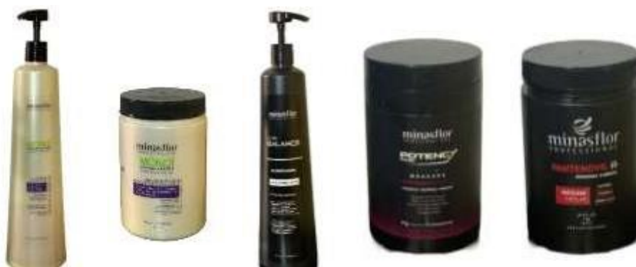
Figura 1- Produtos usados para a higienização capilar e as máscaras que foram usados com o vapor.

No total, foram feitas 5 (cinco) sessões do tratamento, intercalando a máscara de nutrição de Monoī da Minasflor, que ajuda a repor os nutrientes e lipídeos. O acidificante Nutri Balance da Minasflor faz o equilíbrio do ph da haste e também tem ativador de cachos. A máscara de reconstrução Potency da Minaflor ajuda na redução do frizz, elasticidade, porosidade e dá fortalecimento para a haste do cabelo. Por último, a máscara de hidratação Pantenovil da Minasflor, que evita o ressecamento repondo a água que foi perdida e reparando a barreira protetora dos fios.