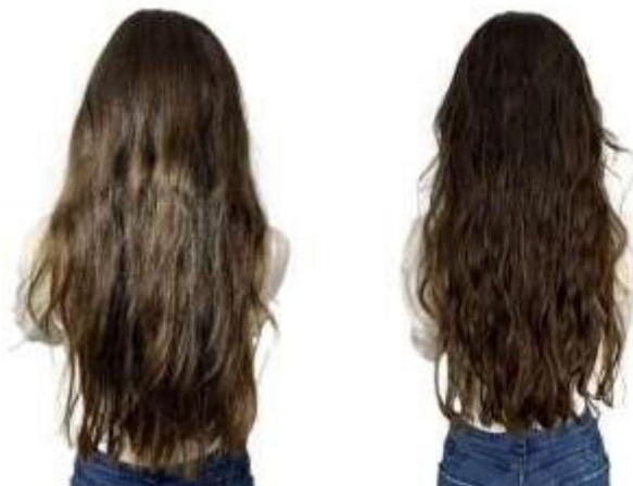
Figura 4 - Antes e depois da primeira sessão com a máscara de nutrição