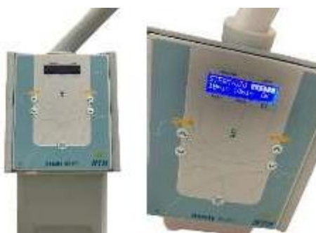
Figura 2 - O vapor de ozônio e o tempo que foi utilizado