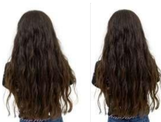
Figura 6 - Resultado da última sessão com a máscara hidratante