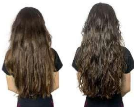
Figura 5 - Antes e depois da terceira sessão com o acidificante