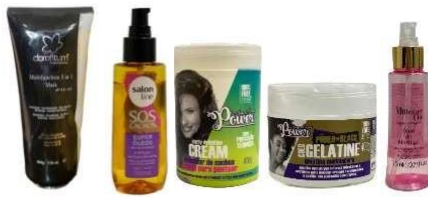
Figura 3 - Produtos usados para a finalização do cabelo