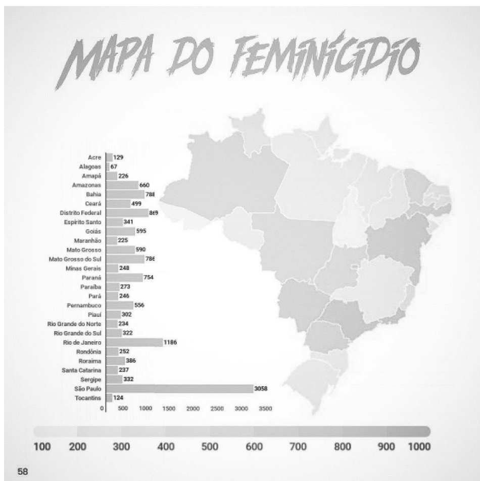
Mapa 2 – Estatística do feminicídio no Brasil no ano de 2019.

O gráfico abaixo mostra uma estagnação da taxa de feminicídio decorrente da violência doméstica e familiar, ainda que muito superior aos anos anteriores é possível observar que o crescimento em relação ao assunto é alarmante.