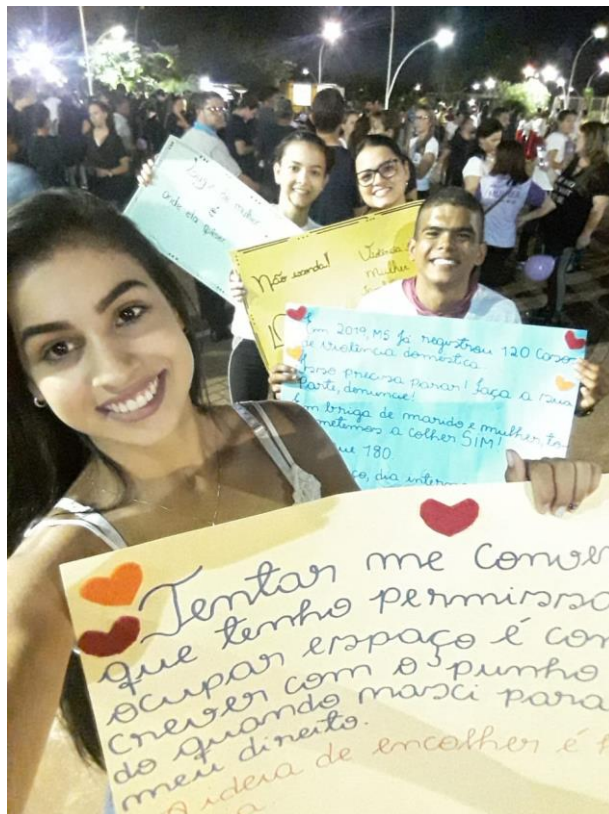
Acadêmicos do curso de Pedagogia na caminhada