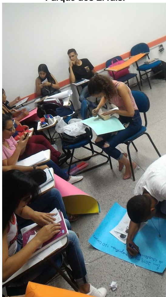
Confecção dos cartazes e lembranças para distribuição no dia 08 de março de 2019, no Parque dos Ervais.