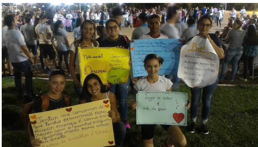
Acadêmicos do primeiro semestre de Pedagogia no Parque dos Ervais