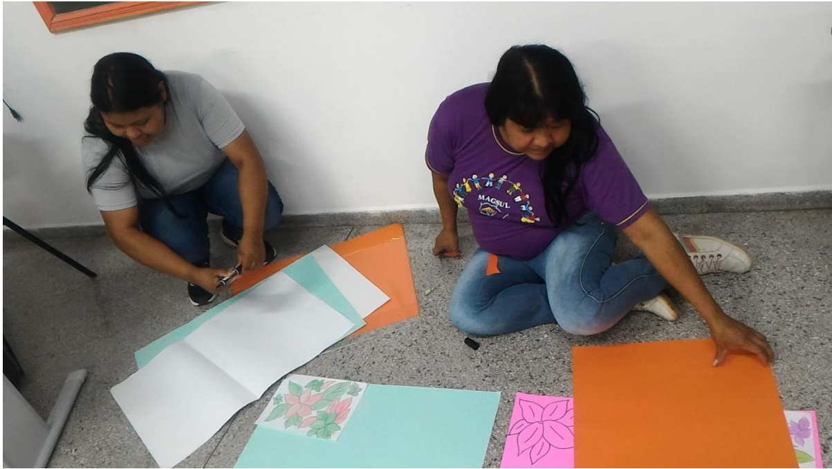
Confecção dos cartazes e lembranças para distribuição no dia 08 de março de 2019 no Parque dos Ervais.