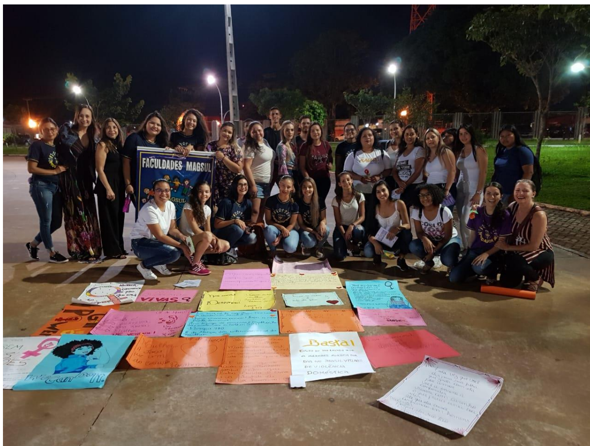
Acadêmicos e professoras no Parque dos Ervais