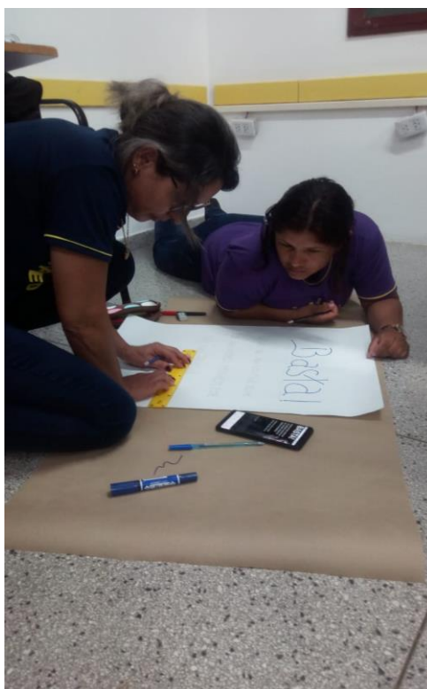
Confecção dos cartazes e lembranças para distribuição no dia 08 de março de 2019 no Parque dos Ervais.