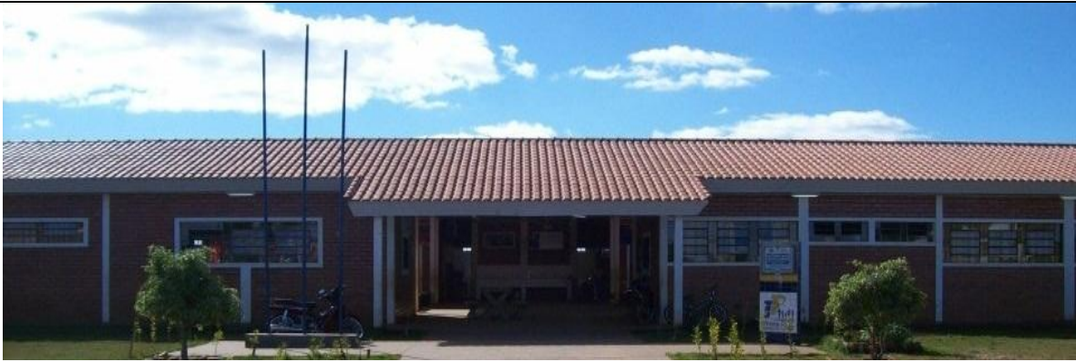
Escola Polo Municipal Ignês Andrezza Endereço: Rua Bertoldo Carvalho, número 100