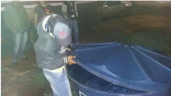
Alunos da EJA , fazendo vistoria na escola.