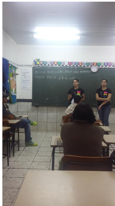
Acadêmicas das Faculdades Magsul, falando sobre a conscientização sobre a dengue.