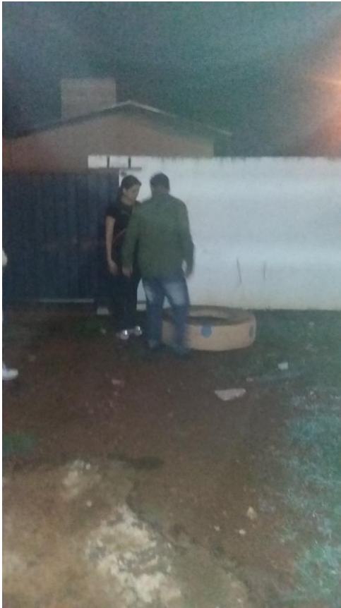
Aluno da EJA , fazendo vistoria na escola.