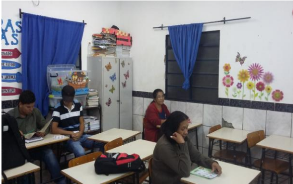
Alunos da educação de Jovens e adultos