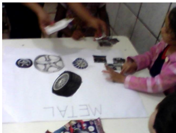
Fig.2. As crianças desenvolvendo as atividades